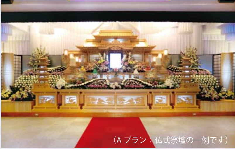
(Aプラン：仏式祭壇の一例です)