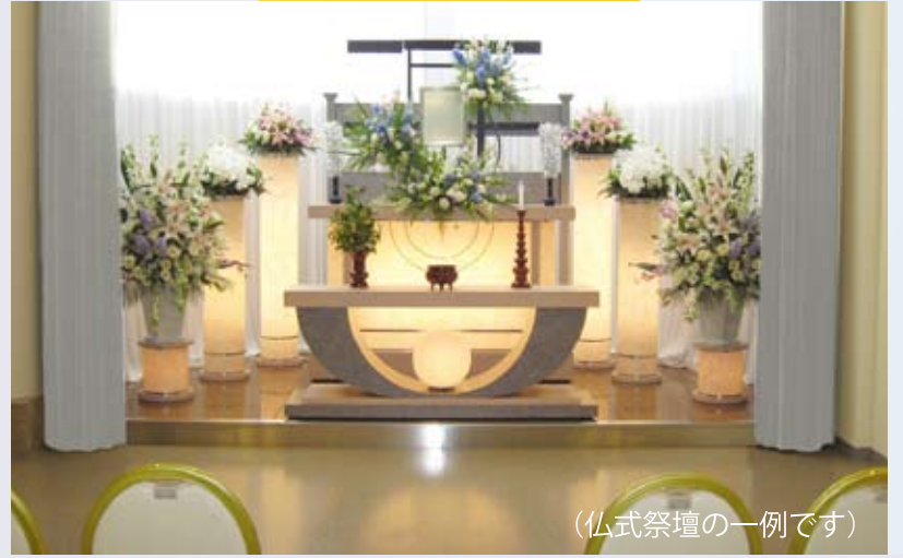
(仏式祭壇の一例です)