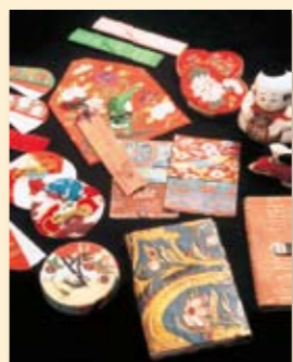
▲大奥老女花園より贈られた大釜(はこせこ)