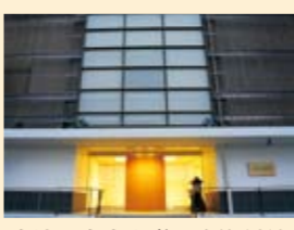
中津川市中山道歴史資料館 中津川市本町2丁目2-21 TEL 0573-66-6888

中津川市中山道歴史資料館には、当時の様子を知ることができる資料などが多数展示されています。