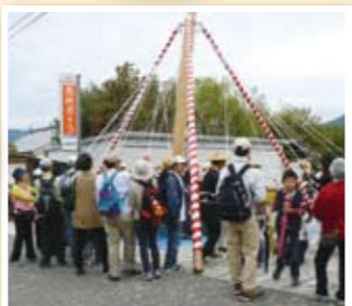
石場搗き餅ふるまい