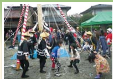
▲石場搗き餅ふるまい