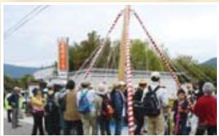
石場搦き餅ふるまい