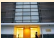
中津川市中山道歴史資料館 中津川市本町2丁目2-21 TEL 0573-66-6888

中津川市中山道歴史資料館には、当時の様子を知ることができる資料などが多数展示されています。