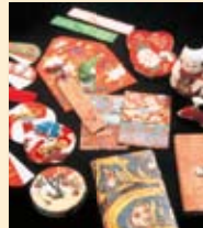
▲大奥老女花園より贈られた 簞追(はこせこ)