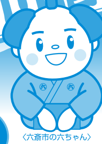
〈六斎市の六ちゃん〉