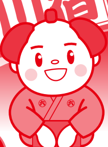
〈六斎市の六ちゃん〉