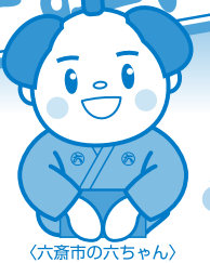
〈六斎市の六ちゃん〉