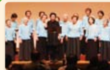
坂下童謡を歌う会