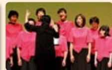
坂下ファミリーコーラス